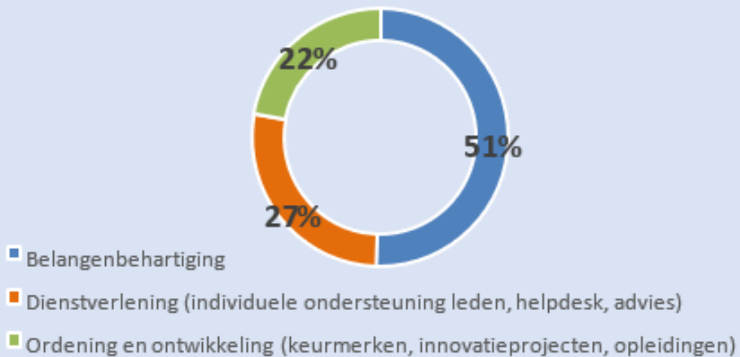
Figuur 1: Verdeling bureaucapaciteit naar kerntaken, “Branches op weg naar 2025”, MKB-Nederland